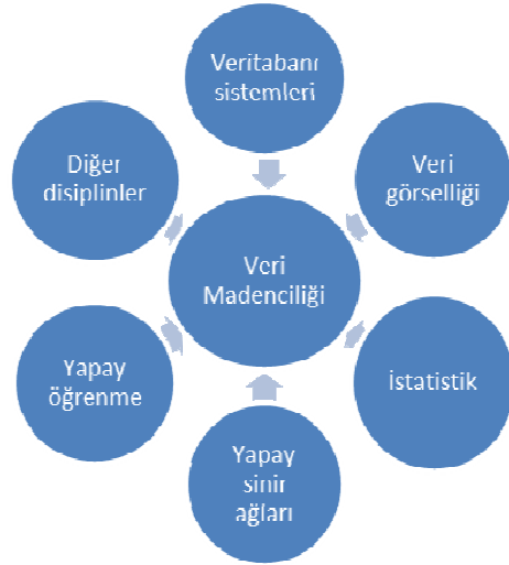
Şekil 1.1. Veri madenciliği ve disiplinler

Veri madenciliği araçları kullanılarak, işletmelerin daha etkin kararlar almasına yönelik karar destek sistemlerinde gerekli olan eğilimlerin ve davranış kalıplarının ortaya çıkarılması mümkün olmaktadır. Geçmişteki klasik karar destek sistemlerinin kullanıldığı araçlardan farklı olarak, veri madenciliğinde çok daha kapsamlı ve otomatize edilmiş analizler yapmaya yönelik, birçok farklı özellik bulunmaktadır (İnan, 2003).